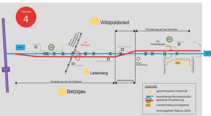
Planungsabschnitt 1 Kempten - Wildpoldsried Vorzugsvariante Süd Nord

Im Planungsabschnitt 1 von Kempten – Wildpoldsried wurden die Planungen im Spätherbst 2017 gestartet. Seitdem waren mehrere Fachbüros mit der Erarbeitung der sog. Vorplanung / Voruntersuchung befasst. Dafür werden mögliche Ausbauvarianten erarbeitet und im Rahmen der Variantenuntersuchung die Vorzugslösung ermittelt. Als Ergebnis kann nun die Variante 4 (Anbau der 2. Fahrbahn im westlichen Streckenabschnitt auf der Südseite und im östlichen Streckenabschnitt auf der Nordseite) als Vorzugslösung benannt werden.